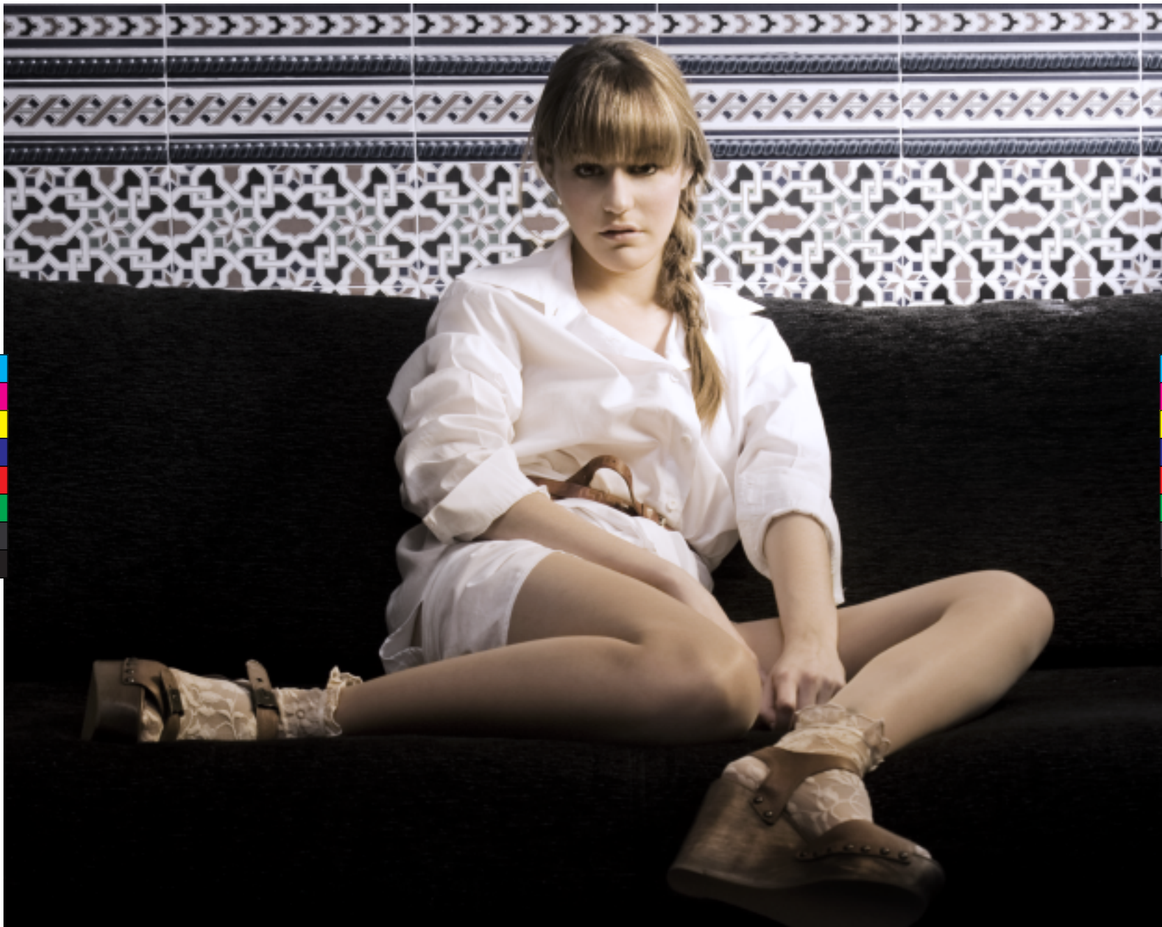
Camisa: Muda Cinturón: Vintage Calcetines: Calzedonia Zapatos: De la estilista